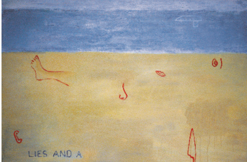
Grief 90 x 120