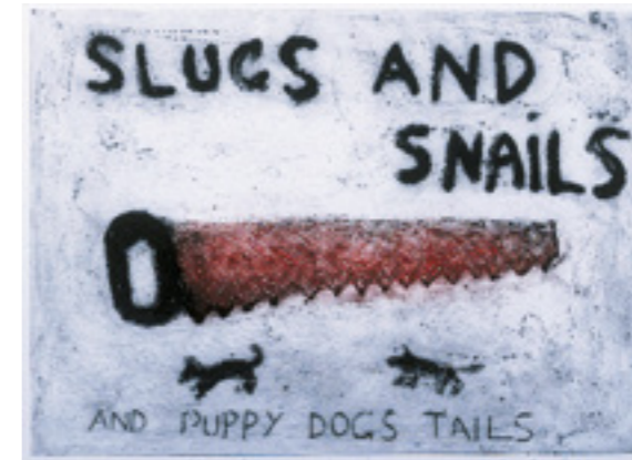
What Are Little Boys Made Of?