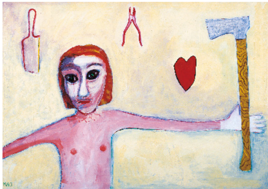
Jente med øks 73 x 104